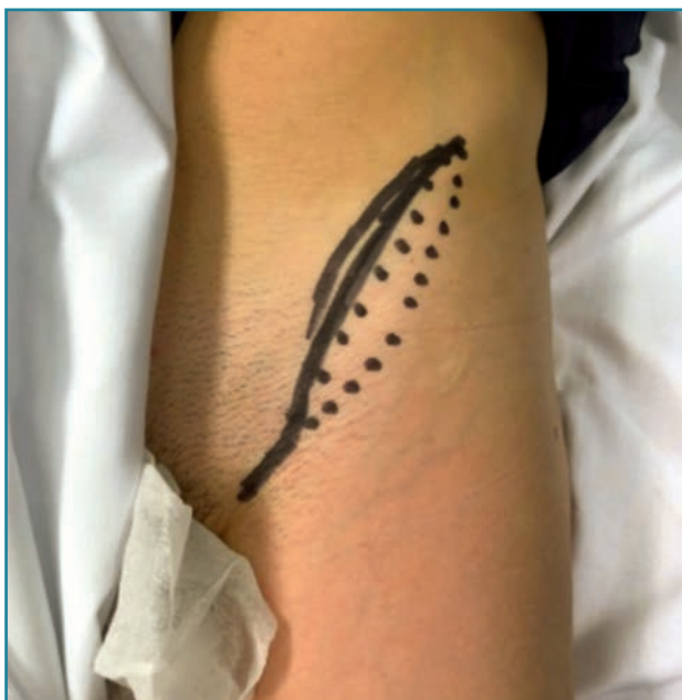
Figura 2. Marcaje de la línea del tubérculo púbico a la cresta ilíaca anterior.