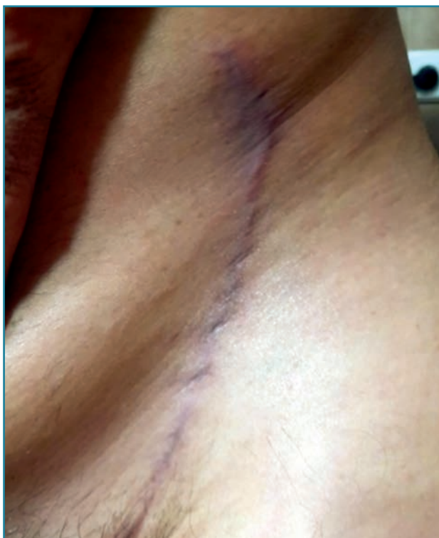
Figura 8. Ninguna molestia en la zona dadora de la ingle.

través de las terminaciones nerviosas del tejido circundante. Por todo ello, creemos que el colgajo inguinal libre a modo de sindactilia descrito en este artículo es una adecuada opción para reconstruir las pérdidas de sustancia digitales múltiples, debido a que aporta una cobertura completa, poca secuela en la zona donante y permite una rápida incorporación al mundo laboral.