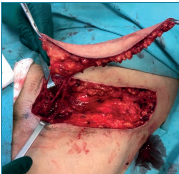
Figura 3. Disección del colgajo.

isla es de 3 cm de ancho por 14 cm de largo ( Figura 3 ). Una vez diseccionado el colgajo, se realiza el clampaje de la arteria circunfleja iliaca superficial y de su vena satélite con hemoclips vasculares del número 9 al nivel de su origen. Una vez elevado el colgajo, el pedículo se irriga con heparina sódica (dilución 1 U en 1 cc de suero fisiológico). Se realiza cierre directo de la zona donante con sutura Maxon® de 2/0 y 3/0.