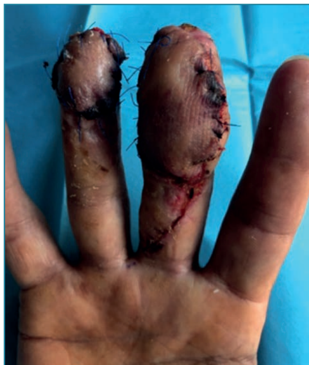
Figura 6. Separación del colgajo para recrear ambos pulpejos.

subcutáneo –s.c.–) y antiagregante (Adiro® 100 mg cada 24 h). A las 48 h se retira el catéter axilar y a los 3 días recibe el alta domiciliaria.