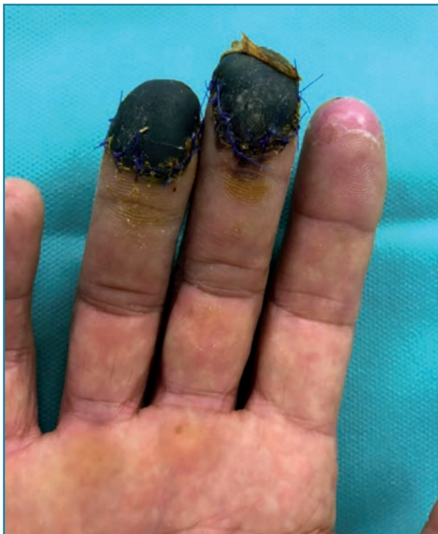
Figura 1. Necrosis completa de los pulpejos de los dedos 3.º y 4.º.

Consideramos que la mejor opción para la cobertura de pérdidas de piel multidigitales son los colgajos microquirúrgicos a modo de sindactilia (5) . Hay varios colgajos libres que hemos usado para el tratamiento de este tipo de lesiones a modo de "colgajo puente", como el colgajo perforante de la primera arteria metatarsiana dorsal (6) , el colgajo de pulpejo del hallux , el colgajo interóseo posterior (7) , el colgajo anterolateral del muslo y el colgajo inguinal libre (8,9) . Dentro de todos los mencionados, es