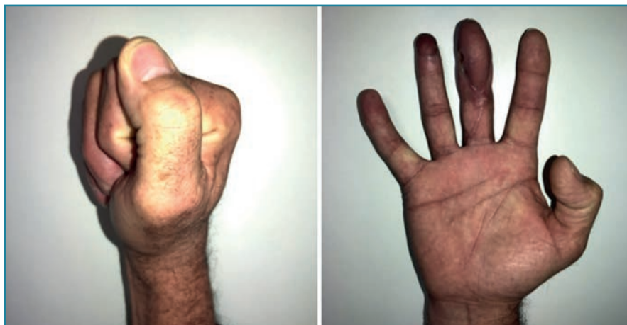
Figura 7. Mínima secuela en la mano.

Consideramos los colgajos microquirúrgicos a modo de sindactilia (sindactilia iatrogénica, sindactilia temporal, colgajo-puente) la técnica de elección para las pérdidas de sustancia que afectan a varios dedos (10) , destacando el colgajo inguinal libre, dada la facilidad de disección, las características anatómicas (flexibilidad y grosor) y la mínima secuela que deja en la zona donante. Los resultados tanto a nivel cosmético