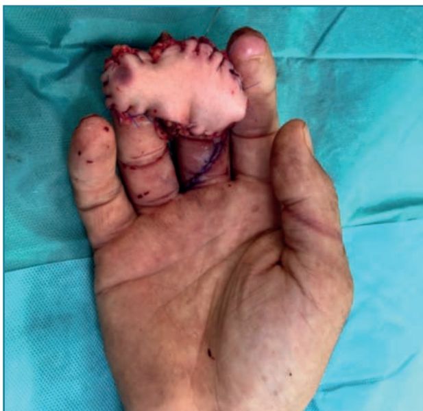
Figura 5. Sutura del colgajo a modo de puente, cubriendo ambos pulpejos.