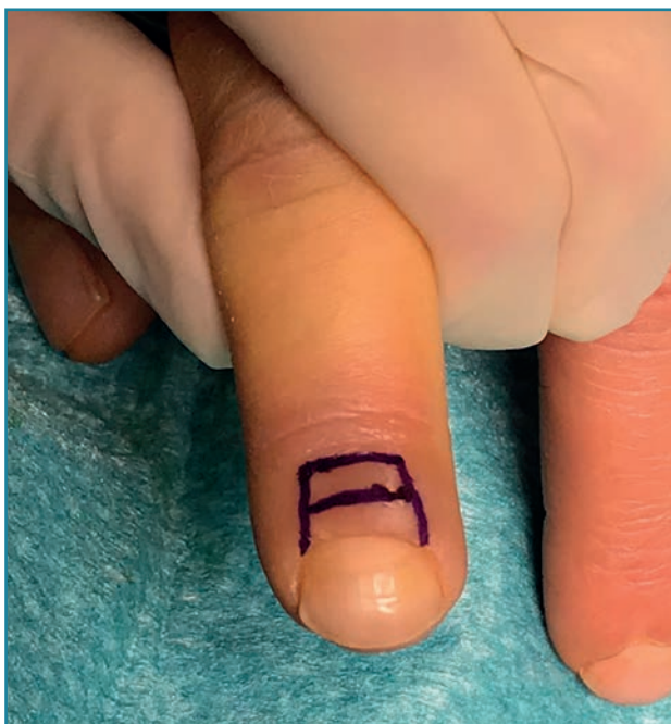
Figura 3. Planificación preoperatoria del colgajo eponiquial.