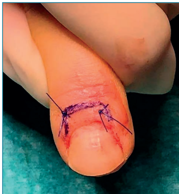
Figura 5. Retracción y sutura del colgajo con aumento de la exposición ungueal.