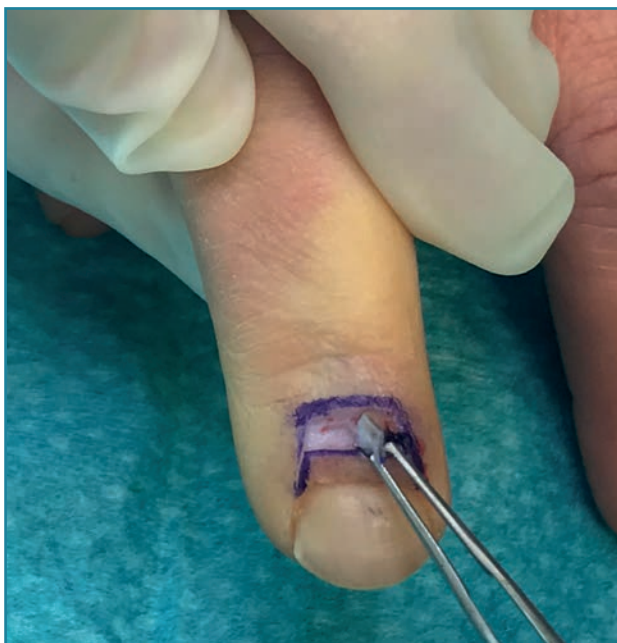
Figura 4. Exéresis de tejido cutáneo.