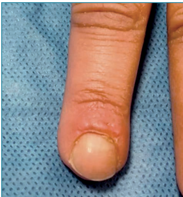
Figura 6. Resultado estético a los 2 meses de la intervención quirúrgica.

ge distal. Cursa reincorporación laboral a las 4 semanas desde el accidente. La paciente refiere un grado de satisfacción alto con el resultado estético y funcional de la mano ( Figura 6 ).