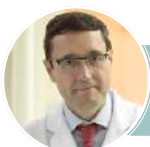
DIRECCIÓN Fernando Marco